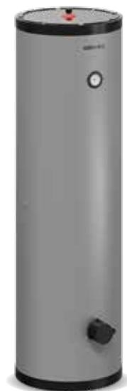
Mileo Inox +