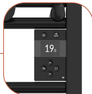
Boitier de commande digital