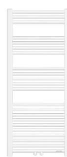
2012 eau chaude